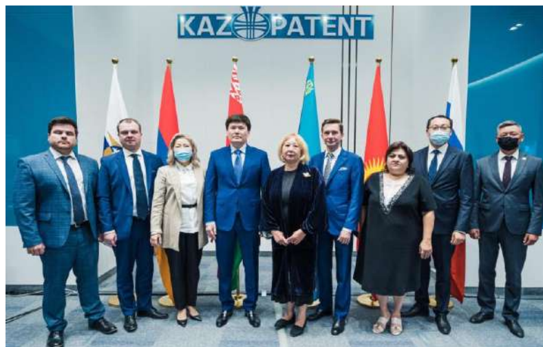
«Антиконтрафакт-2021» форумына қатысушылар

2021 жылғы 26-28 тамызда ҰЗМИ негізінде Қазақстан Республикасының Үкіметі, Еуразиялық экономикалық комиссия және «Антиконтрафакт» Халықаралық қауымдастығы ұйымдастырған «Антиконтрафакт-2021» IX Халықаралық форумы өтті. Бұл іс-шараның басты тақырыбы зияткерлік меншікті жаңа жағдайда қорғау мәселелері болды. Форумға барлығы 625 қатысушы тіркелді. Екі күн ішінде 10 сессия және Жастар форумы әлеуметтік желілерде таратылып, онлайн форматта сарапшылар марафоны өтті.