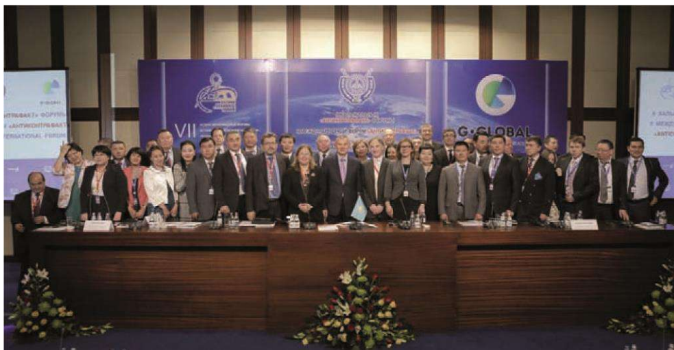
«Антиконтрафакт» II Халықаралық форумының қатысушылары

2021 жылғы 26-28 тамызда ҰЗМИ негізінде Қазақстан Республикасының Үкіметі, Еуразиялық экономикалық комиссия және «Антиконтрафакт» Халықаралық қауымдастығы ұйымдастырған «Антиконтрафакт-2021» IX Халықаралық форумы өтті. Бұл іс-шараның басты тақырыбы зияткерлік меншікті жаңа жағдайда қорғау мәселелері болды. Форумға барлығы 625 қатысушы тіркелді. Екі күн ішінде 10 сессия және Жастар форумы әлеуметтік желілерде таратылып, онлайн форматта сарапшылар марафоны өтті.