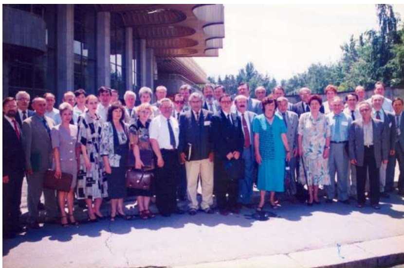
Еуразиялық патенттік ведомство отырысының қатысушылары, Алматы қаласы

Екі жылдан кейін Мәскеуде Әкімшілік кеңестің алтыншы отырысына қатысушылар оның ЕАПҰ қалыптасуының ең жауапты кезеңдерінің бірінде кеңесті басқару бойынша нәтижелі қызметін атап өтті.