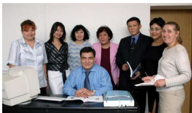
Тауар таңбалары мен өнеркәсіптік үлгілерді сараптау қызметі