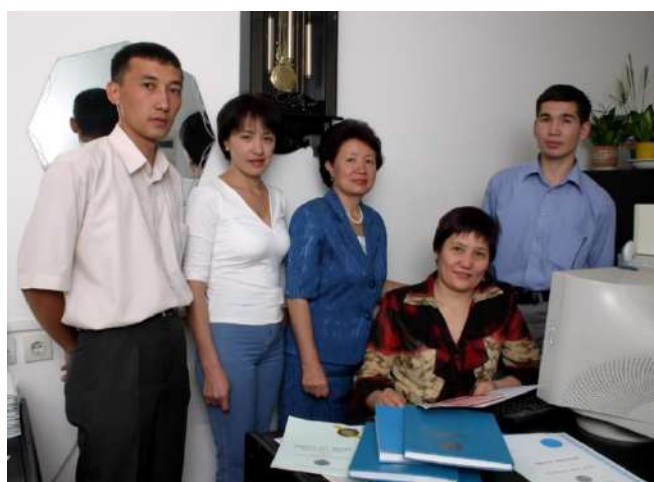
Мемлекеттік тізілімдер қызметі