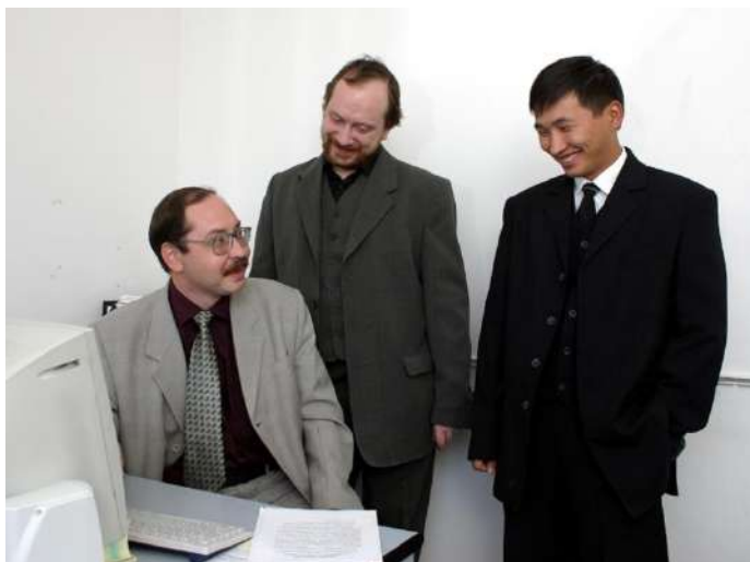
. Ақпараттық технологиялар қызметі