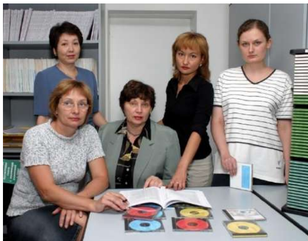
Ақпарат және талдамалық зерттеулер қызметі