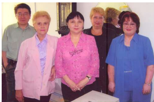
Жарияланым және қоғаммен байланыс қызметі