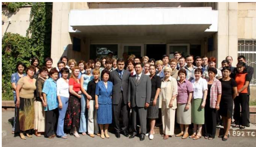
ҰЗМИ ұжымы (2003 жыл)