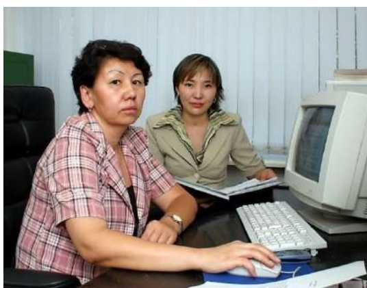
Хат-хабарларды тіркеу қызметі, кадр қызметі