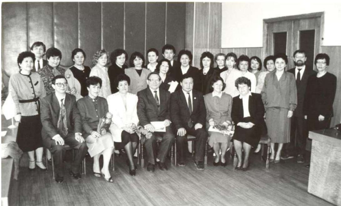
Ұлттық Патент ведомствосының ашылу салтанатына қатысушылар

1993 жылдың сәуірінде Қазақстан Республикасы Министрлер Кабинеті жанындағы Ұлттық Патент ведомствосының салтанатты ашылу таныстырылымы өтті.