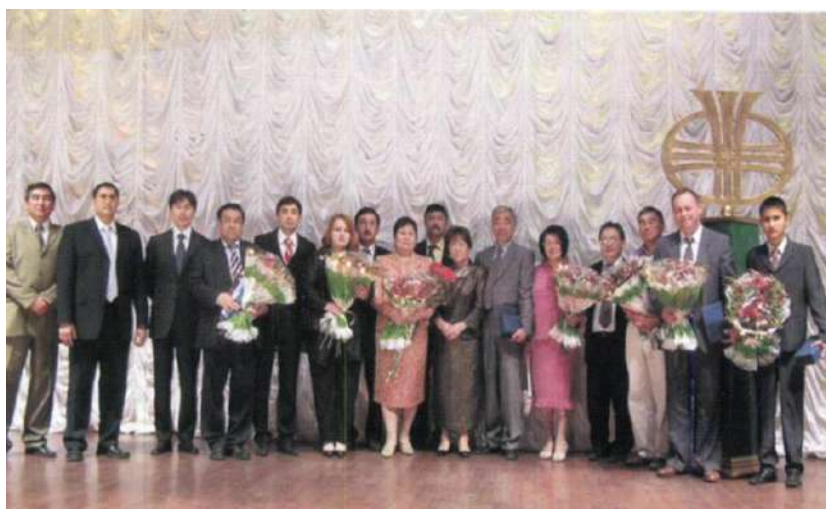
«Шапағат» конкурсының жеңімпаздары (2004 жыл)