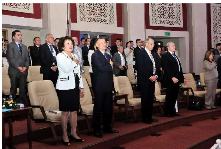
«Шапағат» конкурсы жеңімпаздарын марапаттау рәсіміне қатысушылар (2012 жыл)