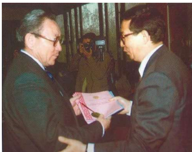
Химия ғылымдары институтының директоры, Қазақстан Республикасы Ұлттық ғылым академиясының академигі Е.Е. Ерғожинге Тәуелсіз Қазақстанның №1 патентін тапсыру

патенті (жұмыс авторлары Е.Е.Ерғожин, Б.А.Мухитдинова, Р.Х.Бакирова. – 16.06.1997 жылғы №2 Бюллетень) Ә.Б. Бектұров атындағы Химия ғылымдары институтының атына және оның директоры Қазақстан Республикасы Ұлттық ғылым академиясының академигі Е.Е. Ерғожинге берілді.