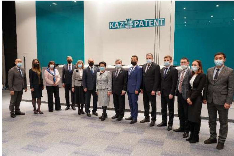
Қазақстан Республикасы Парламенті Мәжілісі жұмыс тобының көшпелі отырысы. ҰЗМИ, 2021 жылғы 21 ақпан

Заң жобалау жұмысының перспективалы бағыттарын айқындау және құқық қолдану практикасының анағұрлым өзекті мәселелерін талқылау үшін бірлескен іс-шаралар өткізілді.