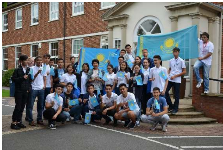
Nazarbayev Fund Scholls Challenge конкурсының жеңімпаздары (2018 жыл)

Оқушылар арасында өткізілетін «Болашақ сенің қолыңда: ойлап тап және жаса» атты үздік эссе жазудың онлайн-конкурсы 2016 жылдан бастап жыл сайын өткізіледі. Конкурс зияткерлік меншік саласындағы білімді насихаттауға, оқушылар арасында шығармашылық белсенділікті ынталандыруға бағытталған. Байқауға еліміздің жалпы білім беру мекемелерінің 8-11 сынып оқушылары қатыса алады. Жұмыстар қазақ, орыс және ағылшын тілдерінде қабылданады. Конкурсқа «Менің сүйікті өнертабысым және ол адамзатқа не береді», «Ежелгі өркениеттердің өнертабыстары», «Өмірді қызықты ететін өнертабыстар», «Өмірді жеңілдететін өнертабыстар», «Өмірді арасалайтын өнертабыстар» тақырыптарындағы эсселер немесе шығармалар жіберіледі. Басым бөлігі ауыл мектептерінің оқушылары юлып табылатын талантты жастар мұндай конкурстарға қатыса отырып, өз әлеуетін пайдалануға тырысады.