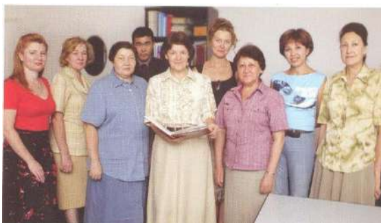
Өнертабыстар мен пайдалы модельдерді сараптау қызметі