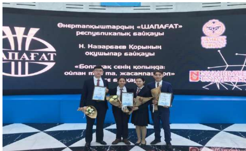
Оқушылар арасында өткізілген үздік эссе конкурсының жеңімпаздары (2018 жыл)

2020 жылы ҰЗМИ-де Жас өнертапқыш мектебі (бұдан әрі – Мектеп ) ашылды. Мектеп оқушылар арасында зияткерлік меншік саласындағы білімді кеңінен таратуға, патенттік мәдениеттің негіздерін сіңіруге және экономикалық жағынан гүлденген және дамыған мемлекет құруда өнертапқыштық пен патенттеудің маңыздылығын түсіндіруге бағытталған. 2021 жылдың соңында ҰЗМИ елорданың 150 оқушысымен кездесу өткізді. 2022 жылы тағы екі мектеппен кездесу ұйымдастырылды. Төртінші мектеп «Контрафакт» республикалық акциясы аясында өткізілді. Мектеп бағдарламасында заманауи өнертабыстар, ежелгі өнертабыстар, өнертапқыштар туралы, өнертабыстарды патенттеудің артықшылықтары туралы түрлі дәрістер қарастырылған. Сондай-ақ бағдарламаға көңілді викториналар, интербелсенді практикумдар мен қойылымдар енгізілген. Іс-шаралар БАҚ пен әлеуметтік желілерде кеңінен жарияланады.