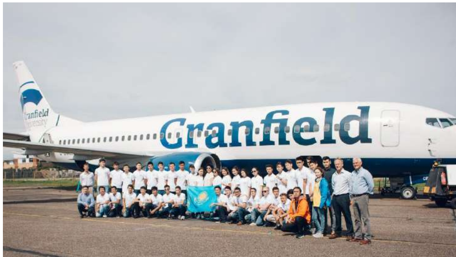
Nazarbayev Fund Scholls Challenge конкурсының жеңімпаздары (2017 жыл)