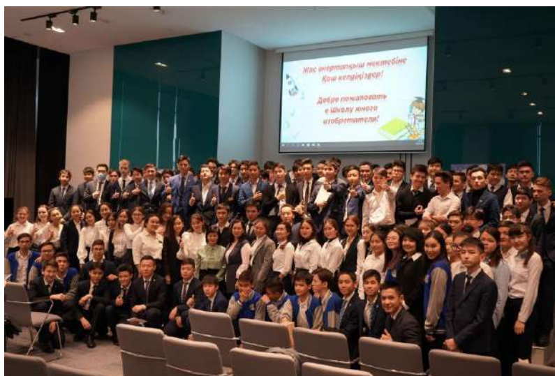
Жас өнертапқыш мектебінің қатысушылары. ҰЗМИ (2020 жыл)

2020 жылы ҰЗМИ-де Жас өнертапқыш мектебі (бұдан әрі – Мектеп ) ашылды. Мектеп оқушылар арасында зияткерлік меншік саласындағы білімді кеңінен таратуға, патенттік мәдениеттің негіздерін сіңіруге және экономикалық жағынан гүлденген және дамыған мемлекет құруда өнертапқыштық пен патенттеудің маңыздылығын түсіндіруге бағытталған. 2021 жылдың соңында ҰЗМИ елорданың 150 оқушысымен кездесу өткізді. 2022 жылы тағы екі мектеппен кездесу ұйымдастырылды. Төртінші мектеп «Контрафакт» республикалық акциясы аясында өткізілді. Мектеп бағдарламасында заманауи өнертабыстар, ежелгі өнертабыстар, өнертапқыштар туралы, өнертабыстарды патенттеудің артықшылықтары туралы түрлі дәрістер қарастырылған. Сондай-ақ бағдарламаға көңілді викториналар, интербелсенді практикумдар мен қойылымдар енгізілген. Іс-шаралар БАҚ пен әлеуметтік желілерде кеңінен жарияланады.