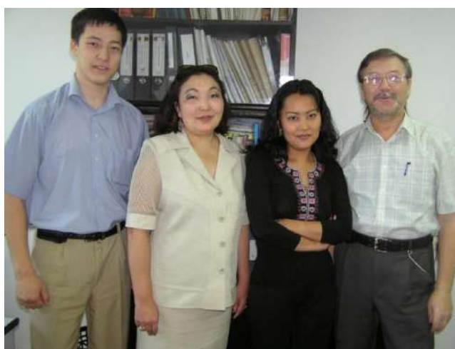
Коммерцияландыру және бағалау қызметі