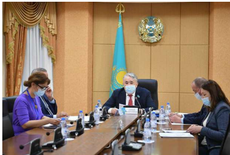
Қазақстан Республикасы Парламенті Сенатының Конституциялық заңнама, сот жүйесі және құқық қорғау органдары комитеті мүшелерінің зияткерлік меншік құқықтарын қорғау мәселелері бойынша Қазақстан Республикасы Әділет министрлігінің және ҰЗМИ-дің басшылығымен 2021 жылғы 29 сәуірдегі кездесуі (онлайн режимде)

Заң жобалау жұмысының перспективалы бағыттарын айқындау және құқық қолдану практикасының анағұрлым өзекті мәселелерін талқылау үшін бірлескен іс-шаралар өткізілді.