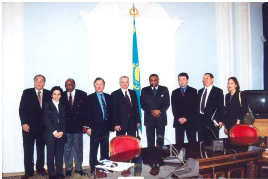
ДЗМҰ делегациясының Ұлттық Патент ведомствосына сапары

Ұлттық Патент ведомствосы мемлекеттік органдар арасында алғашқылардың бірі болып еуразиялық ынтымақтастық идеясын жүзеге асыру бойынша қадамдар жасады. Қазақстан Республикасының атынан өкілдік ететін Ұлттық Патент ведомствосының өкілдері ТМД елдерінің өнеркәсіптік меншігін қорғау мәселелері жөніндегі Мемлекетаралық кеңесті құруға тікелей қатысты. Оның ең елеулі жетістігі Еуразиялық патенттік конвенцияның тұжырымдамасын (1994) әзірлеу болды.